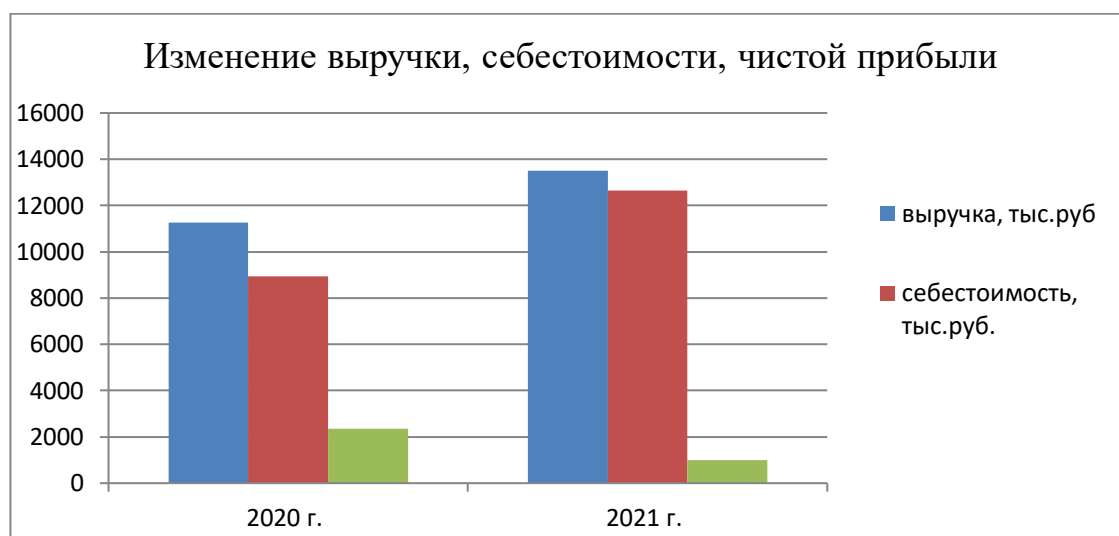
Рисунок 3 – Изменение показателей выручки, себестоимости и чистой прибыли